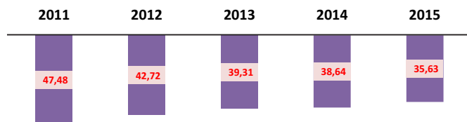
Gráfico N° 2 Evolución de la brecha o intensidad de la pobreza total en (%).

Brecha o intensidad: Es el porcentaje del valor de la canasta básica de consumo que en promedio un hogar pobre no logra cubrir con sus ingresos.